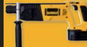
DW999K2/DW999K2H Vrtací kladivo 18 V