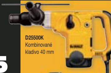
D25500K Kombinované kladivo 40 mm