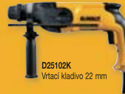
D25102K Vrtací kladivo 22 mm