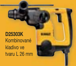
D25303K Kombinované kladivo ve tvaru L 26 mm