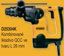
D25304K Kombinované kladivo QCC ve tvaru L 26 mm