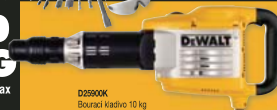
D25900K Bourací kladivo 10 kg