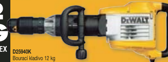
D25940K Bourací kladivo 12 kg