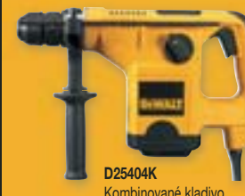
D25404K Kombinované kladivo 32 mm