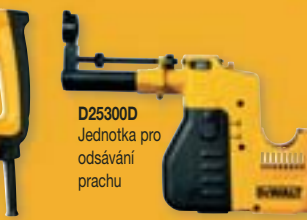
D25300D Jednotka pro odsávání prachu