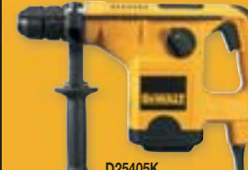
D25405K Kombinované kladivo QCC 32 mm plus sada příslušenství