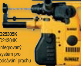
D25305K D24304K Integrovaný systém pro odsávání prachu