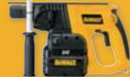
DW005K2C/DW005K2H Akumulátorové kombinované kladivo 24 V