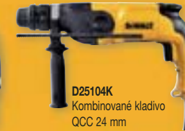
D25104K Kombinované kladivo QCC 24 mm