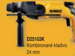
D25103K Kombinované kladivo 24 mm