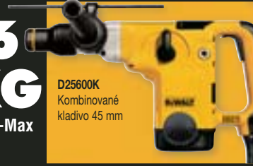
D25600K Kombinované kladivo 45 mm