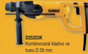
D25203K Kombinované kladivo ve tvaru D 26 mm