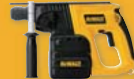
DW004K2/DW004K2H Akumulátorové vrtací kladivo 24 V